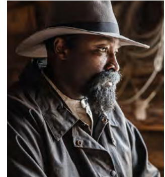
Sur les traces de John Ware

Apprentissage autonome Apprentissage par enquête