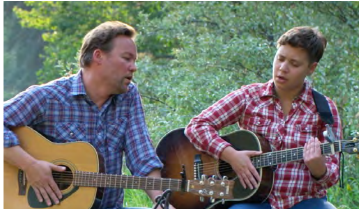
Sur les traces de John Ware

Apprentissage autonome Discussion en petits groupes