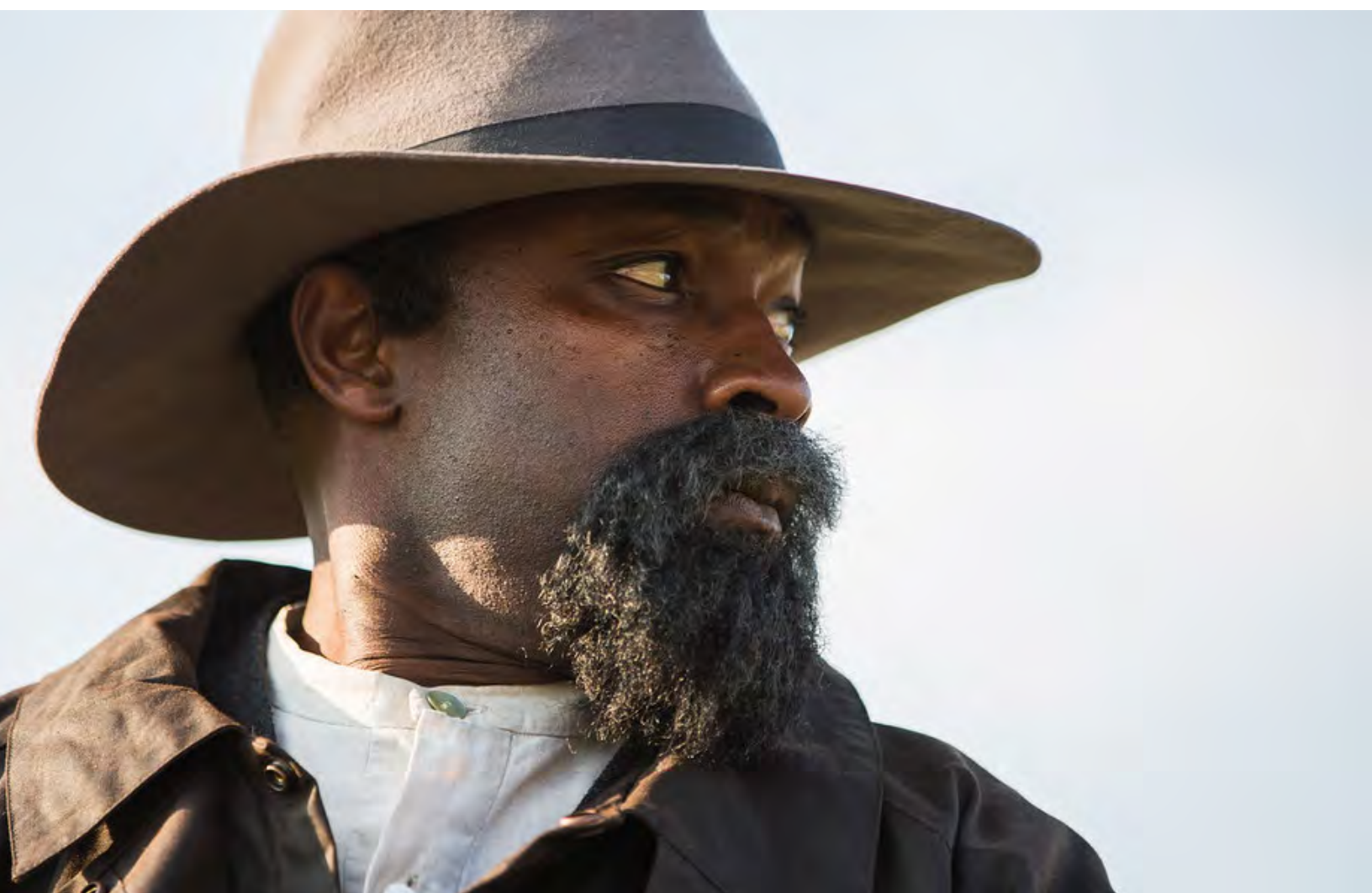
Sur les traces de John Ware

Ce guide convient aux élèves de 13 ans et plus.