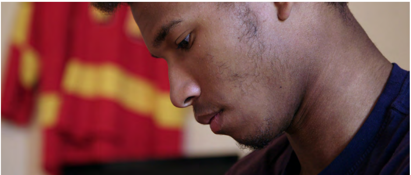
La ligue oubliée

Le racisme envers les Noirs est vécu de manière très différente selon l'entrelacement de la race et d'autres dimensions de l'identité d'une personne telles que le genre, la classe sociale, l'orientation sexuelle, la religion, la citoyenneté et le statut d'immigration, et l'absence ou la présence d'un handicap. L'intersectionnalité est la manière dont la vie d'une personne est façonnée par son identité et sa situation sociale qui se superposent et produisent une expérience propre à cette personne. De la même façon, l'intersectionnalité touche les groupes de personnes où la vie de chacun des membres est façonnée par les diverses identités et situations sociales qui se superposent dans le groupe. Le concept d'intersectionnalité a été introduit par Kimberlé Crenshaw et est ancré dans la théorie critique de la race. Les recherches de Kimberlé Crenshaw s'appuient sur une longue tradition d'études et de militantisme de féministes noires qui cherchent à comprendre les situations de marginalisation des femmes et des filles noires, fondées à la fois sur le genre et la race. L'intersectionnalité crée ainsi des rapports de force, des obstacles et des inégalités supplémentaires pour les femmes noires au Canada.